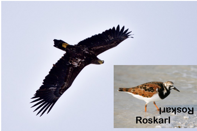
Havsörn häckar i Söderarmsskärgården